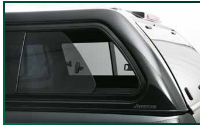
Schiebefenster (links und rechts)

Ab sofort bekommen Sie mit Ihrem neuen Amarok auf Wunsch auch das Hardtop Komfort-Paket mit ausgeliefert.