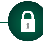
Zentralverriegelung mit nur einem Schlüssel Fahrzeug und Hardtop öffnen