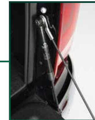
Bordwanddämpfer langsames und sanftes Öffnen der Bordwand

Welche Features beinhaltet unser Angebot für Sie?